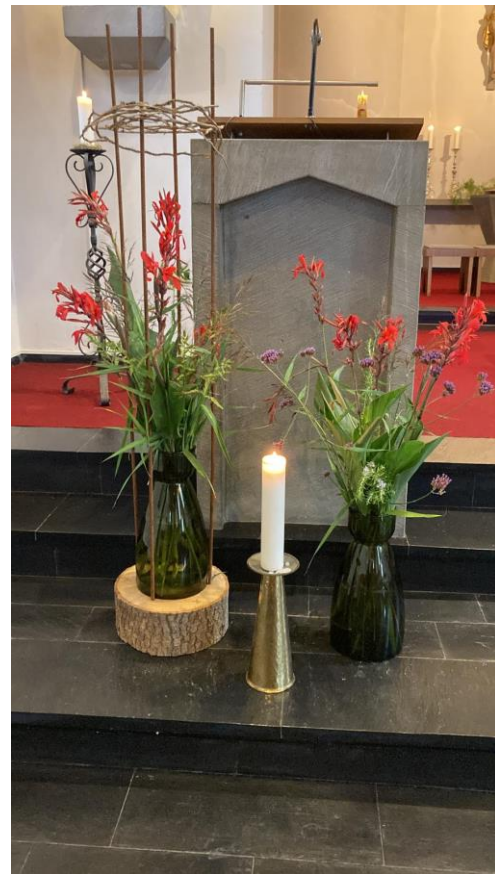
Kirche immer wieder wunderbar geschmückt