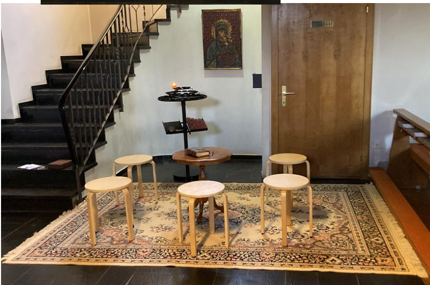
Auszeit während der Fastenzeit in unserer Pfarrkirche