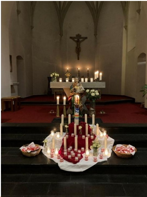
Messfeier an Maria Lichtmess mit geweihten Kerzle für die Mitfeiernden