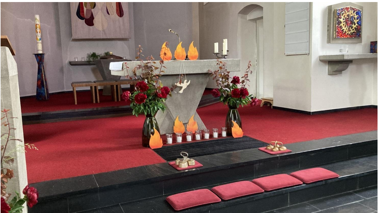
Pfingsten mit den sieben Gaben des Heiligen Geistes