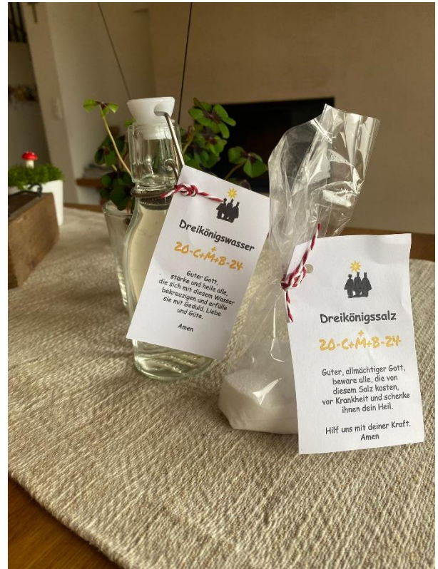
Dreikönigswasser und Salz für die Mitfeiernden bei der Messfeier am 6. Jänner.